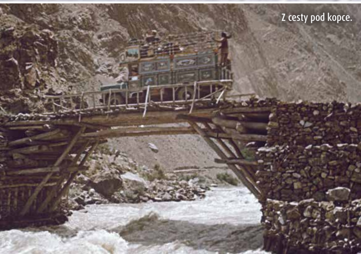
Z cesty pod kopce.

Afganistan, pohorie Hindukúš, Vachánsky koridor (jún – september 1965)