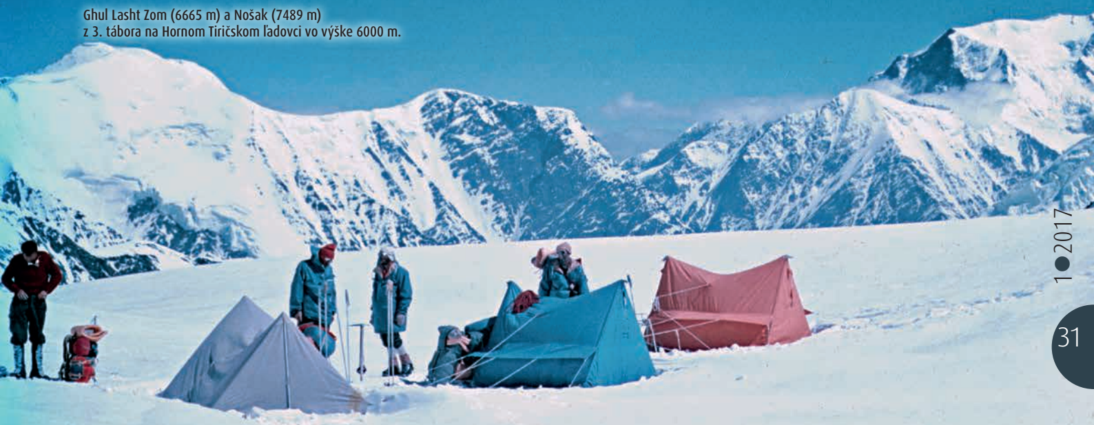
Ghul Lasht Zom (6665 m) a Nošak (7489 m) z 3. tábora na Hornom Tiričskom ladovci vo výške 6000 m.