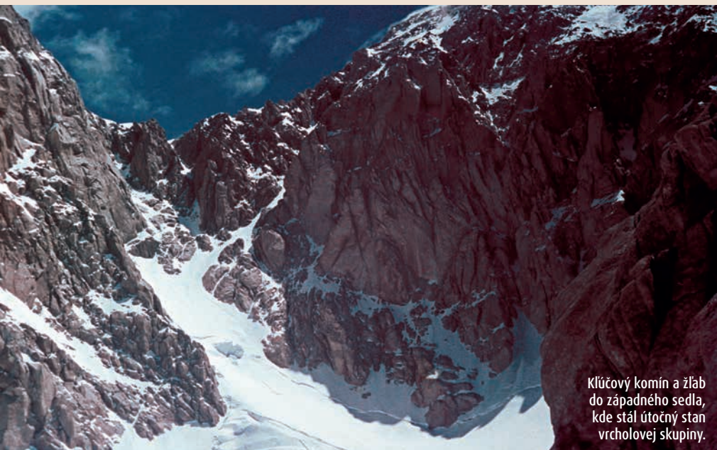
Kľúčový komín a žľab do západného sedla, kde stál útočný stan vrcholovej skupiny.

Západný Tirič Mir II (7460 m) – 19. 8. 1974 vystúpili na vrchol Taliani Beppe Re a Guido Machetto