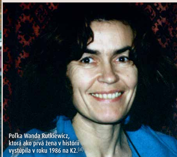
Polka Wanda Rutkiewicz, ktorá ako prvá žena v histórii vystúpila v roku 1986 na K2.