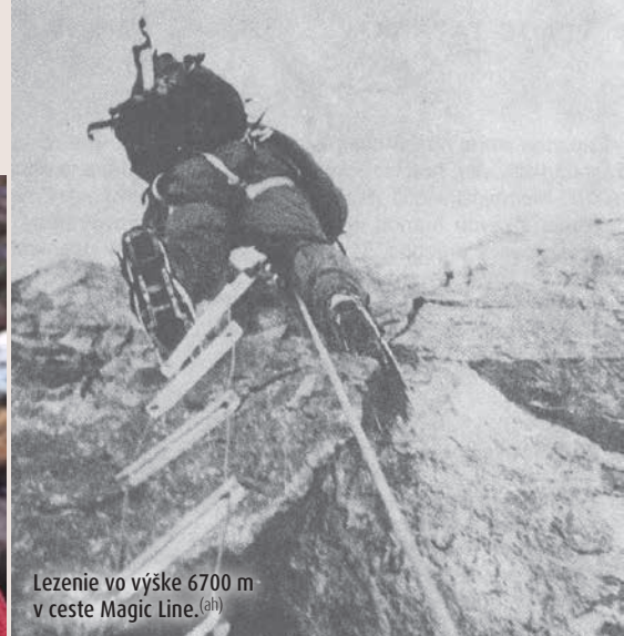
Lezenie vo výške 6700 m v ceste Magic Line.

dorazili o druhej ráno do štvrtého tábora na ramene K2, kde sa práve na vrcholový výstup pripravovala sedemčlenná skupina horolezcov zložená z členov viacerých expedícií. Medzi nimi aj členka ich výpravy Mrówka, ktorá sa v priebehu expedície rozhodla pre výstup Abruzziho rebrom a pridala sa k Britovi Alanovi Rouseovi. Napriek kritickému nedostatku miesta, keď sa v troch malých stanoch vo výške 8000 metrov už druhú noc tiesnilo desať horolezcov, sa obeť postarala o vyčerpaných kamarátov. Alan sa rozhodol stráviť noc v záhrabe, aby Božíkovi a Piaseckému uvoľnil miesto vo svojom stane. Keď ráno Al a Mrówka vyrazili spolu s ostatnými na vrcholový výstup, Božík s Piaseckim si v ich stane odpočinuli a pokračovali v zostupe. Ešte v ten istý deň sa im podarilo zostúpiť do tretieho tábora a v ďalších dňoch bezpečne dorazili do základného tábora, kde sa 8. júla stretli s ostatnými členmi expedície, ktorí sa vo výške 8200 metrov otočili hneď potom, ako sa dozvedeli o Wrózovej smrti. Skončilo sa ďalšie veľké horolezecké dobrodružstvo a magická línia juho-juhozápadného hrebena sa po Kukuczckovej a Piotrowského „Polish Line“ stala druhou perlou tejto sezóny.